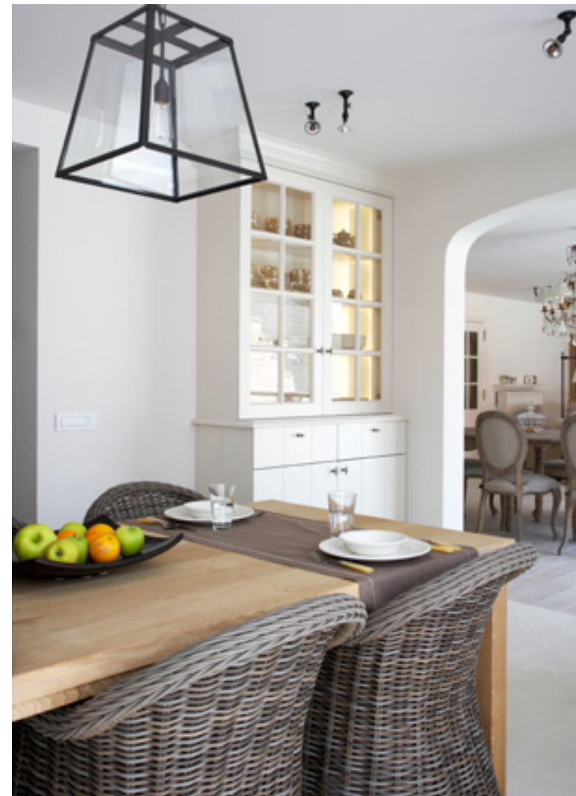
De woonkeuken is ruim en helder. Het wandmeubel werd 'rond' het Aga-fornuis ontworpen. Ook de witte (ingebouwde) vitrinekast is een ontwerp van Josfien Maes. De spotjes en de lichtarmaturen in glas en staal zijn van Nautic.

Van meubilair over verlichting, accessoires, huisraad, lakens en handdoeken ... alles is nieuw