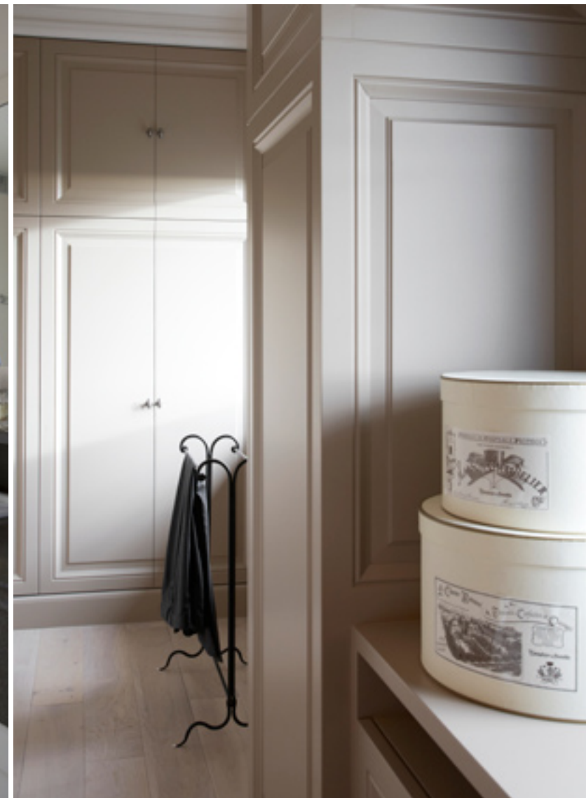
Foto links: de compacte badkamer heeft enkel een wastafel en een douche. De landelijke stijl werd hier in een sobere uitvoering toegepast. Foto's rechts en rechterpagina: de slaapkamer en dressing lopen in elkaar over. De radiatoren werden door een fraai wandmeubel aan het oog onttrokken en bieden zelfs nog extra bergruimte.

den. Opnieuw valt het millimeterwerk op. De ruimte van de dressing werd maximaal benut en in de slaapkamer zelf zijn de radiatoren weggevoerd door een omkasting, waar ook nog eens extra bergruimte is aangebracht. De kamer zelf is vrij compact, maar groot genoeg om er toch voldoende bewegingsruimte te hebben. Bovendien loopt in deze ruimte dezelfde schuine muur als in de woonkamer door. Ook hier is die rechtgetrokken door een voorzetwand, waarin een nisje werd gemaakt dat als nachtkastje dient.